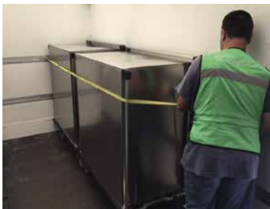
Photo n° 1 Système de fixation dans le camion de transport (réf : Nicole Berset).

Un système de fixation doit être prévu pour immobiliser les armoires de transport pour toute la durée du transport.