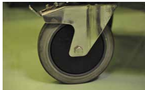
Photo n° 4 Roue de l'armoire de transport (réf : Tiziano Balmelli).