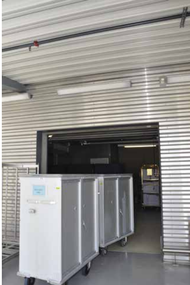
Photo n° 6 Place de chargement/déchargement.

Les locaux de chargement et de déchargement doivent assurer une protection adéquate contre le rayonnement solaire direct sur les armoires de transport.