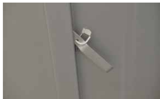
Photo n° 5 Plombage de l'armoire de transport (réf : Tiziano Balmelli).