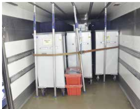
Photo n° 2 Système de fixation dans le camion de transport (réf : Tiziano Balmelli).